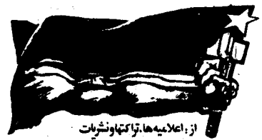
از اجلاس هیئت کارگران و شتاب