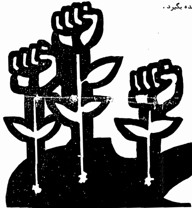
محدودیت کار سندیکا

وضعیت و مسائل طبقه کارگر و انتخاب صحیح‌ترین اشکال و شیوه‌های مبارزه در جهت خواست‌های کارگران است. البته همه این کارها باید در چهارچوب برنامه‌ای که در مجمع عمومی به تصویب رسیده، عملی گردد. سندیکا تنها وقتی میتواند نقش موثری داشته باشد که دربرگیرنده اکثریت کارگران فعال و مبارز باشد در جهت خواست‌های واقعی کارگران حرکت کند. سندیکا باید پیوندش را با اعضا همواره مستحکم تر سازد و پاسخگوی نیازهای کارگران باشد. کارگران بایستی در انتخاب هیئت‌مدیره و اعضا مسئول سندیکا زیاد دقت کنند. این اشخاص باید از میان عناصر صادق و وفادار به طبقه و صنف خود باشند. در مبارزات کارگران صادقانه شرکت داشته و دارای تجربه مبارزاتی باشند.